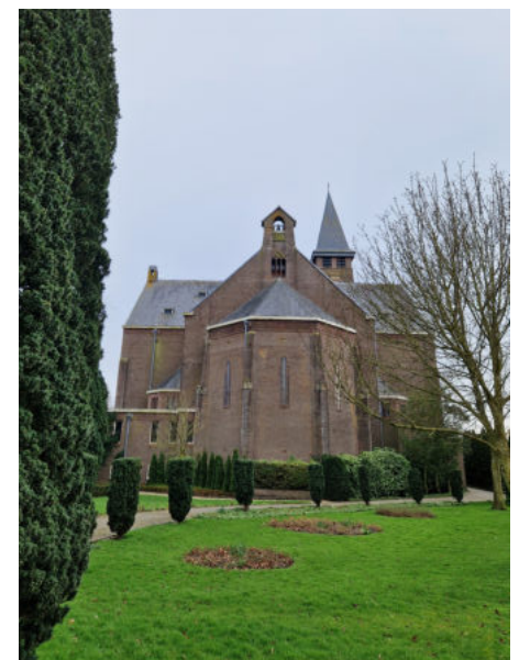
Johannes de Doper-kerk in Grootebroek.