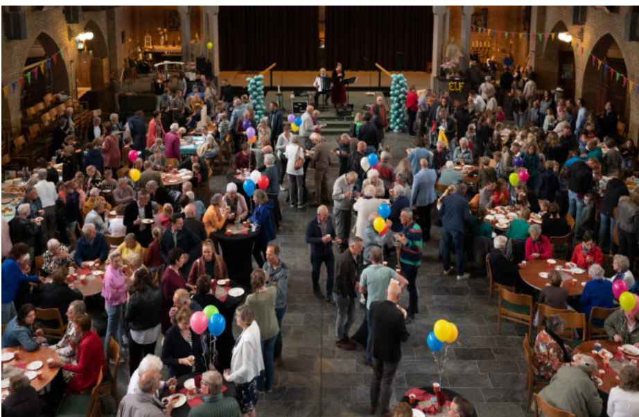
De kermisbrunch in Hoogkarspel op Hemelvaartsdag.

Op de Johannes de Doper-kerk in Grootebroek vinden we een niet alledaags kerkornament. Op de noordzijde van de imposante kerk, gebouwd in de periode 1926 - 1929 staat een kleine klokkentoren met een bijzonder klokje. Dit is een zo genoemd elevatie-klokje. Opmerkelijk aan dit elevatie-klokje is, dat het sinds de restauratie in 2016, weer in gebruik is. Een elevatie-klokje